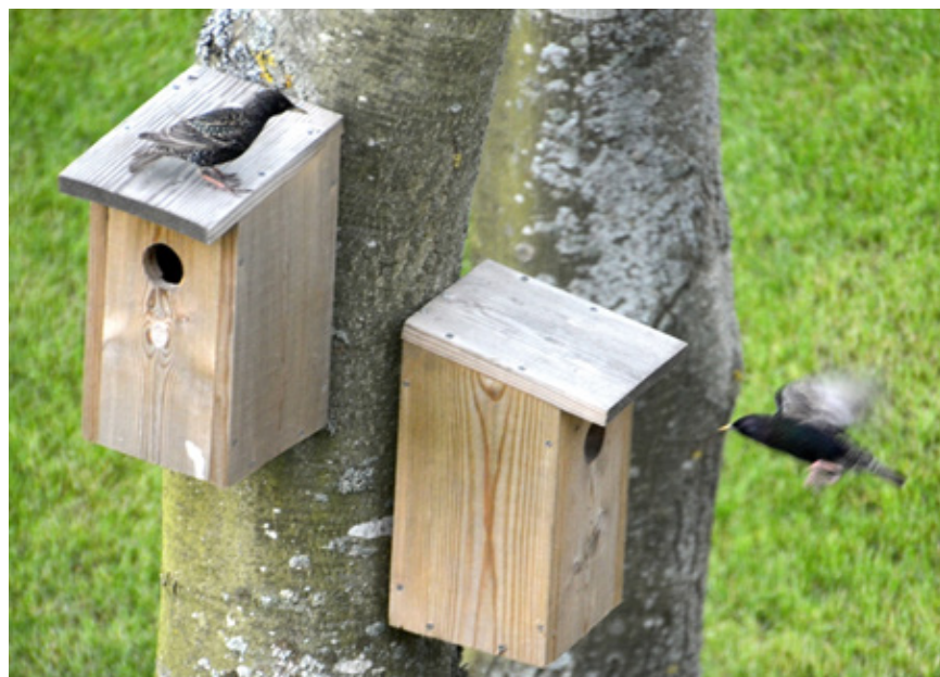
"Blok 8", hvor beboerne bor gratis - til gengæld skal de spise insekter